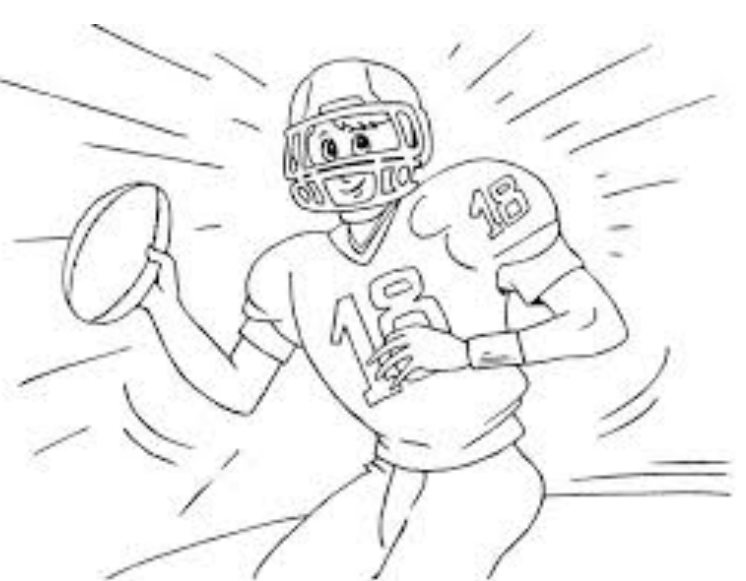
Terrain de Football américain

Le terrain est de forme rectangulaire. Il mesure 110 mètres de long et 48 mètres de large Durée du match : 60 minutes effectives pour environ 11min d'actions de jeu.