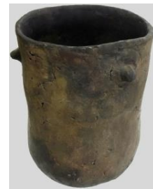
Doc E : une poterie - site du lac de Paladru